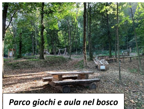
Parco giochi e aula nel bosco