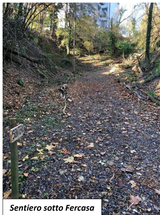
Sentiero sotto Fercasa