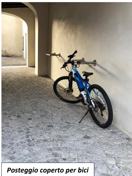
Posteggio coperto per bici